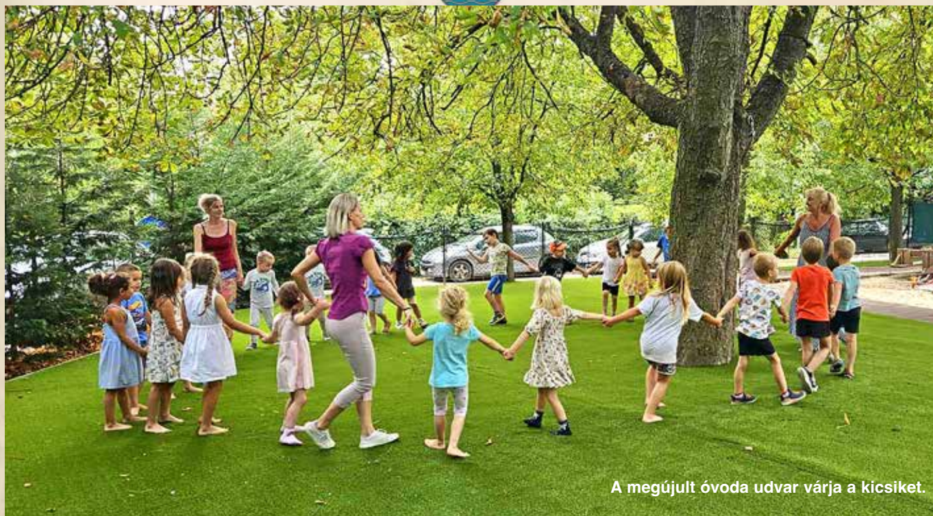
A megújult óvoda udvar várja a kicsiket.